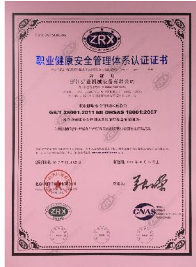
职业健康安全管理体系证书