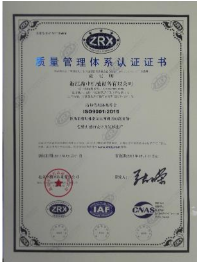
质量管理体系认证证书

公司顺利通过了 ISO19001-2015 质量管理体系认证，ISO14001 环境管理体系和 OHSAS18001 职业健康安全管理体系。