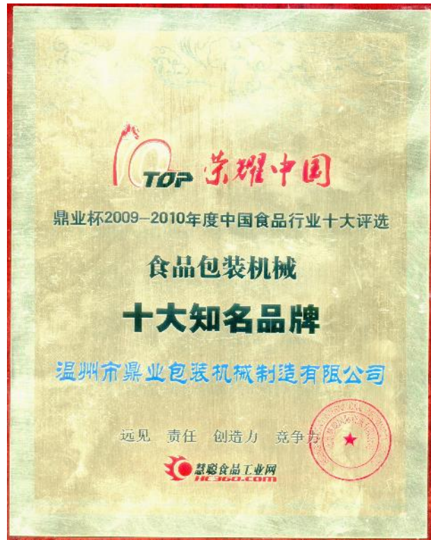
食品包装机械十大知名品牌