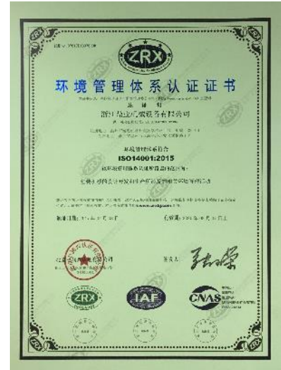
环境管理体系认证证书