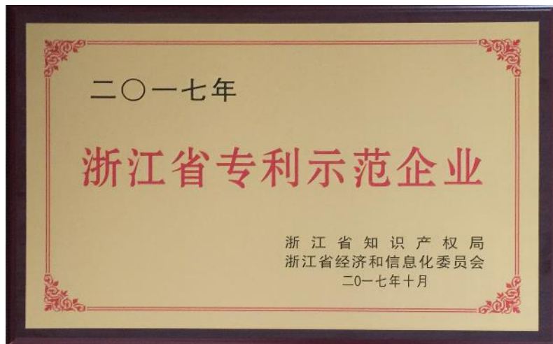
浙江省专利示范企业

本公司生产加工场所、生产设备、设施、检测仪器、管理人员、技术人员等在同行业中处于先进水平，符合相关国家法律、法规要求，产品满足顾客安全使用需求，获得了“高新技术企业”、“省级研发中心”、“浙江省专利示范企业”、“省科技型中小企业”、“食品包装十大品牌”、“温州市科技（创新）型企业”等多项殊荣。取得了“知识产权管理体系”、“温州市知名商标”等荣誉和证书。